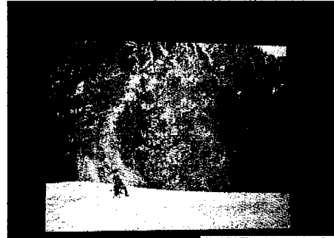
Carsten Holler, Neon Circle, 2003 Veduta dell'installazione nel Padiglione Italia della 50° Esposizione Internazionale d'Arte la Biennale di Venezia